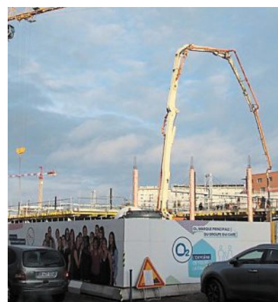
Siège de Oui Care-O2.