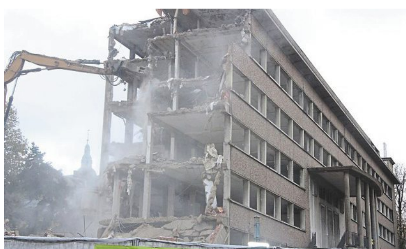
Adieu, la vieille cité administrative.