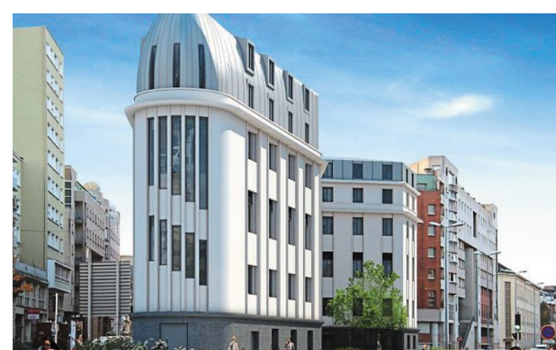
La future résidence universitaire.