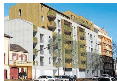
Les Collines de Cérézia.

Les Collines de Cérézia, réparties en trois bâtiments de 3 et 5 étages, profiteront d'une façade bois, d'une toiture végétalisée et de 103 places de parking. Livraison : mars 2022.