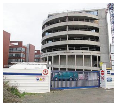
Le bâtiment Bonnafé.

Sur le même site, Art Prom annonce un nouveau chantier (sept millions d'euros) qui démarre début 2020. Cade, c'est son nom, s'étalera sur