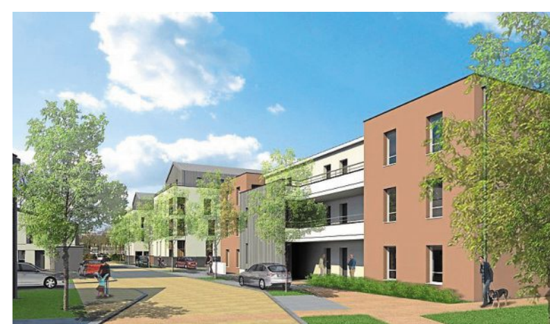
La future résidence Beau'Lieu.