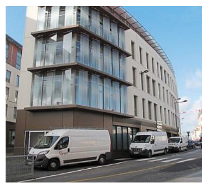
Le siège d'Unyc.

Bureaux, salle de sport... C'est la société tourangelle Art Prom qui s'est occupée de la construction (2 300 m 2 ) de quatre étages plus ter-