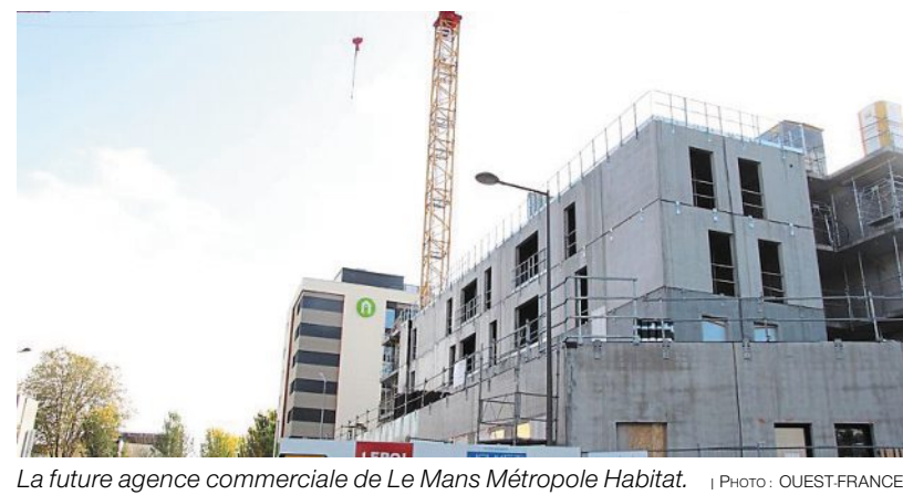
La future agence commerciale de Le Mans Métropole Habitat.

Derrière l'hôtel Campanile, 8, boulevard Robert-Jarry, l'ancienne station essence fait place aux futurs bâtiments de l'agence commerciale de Le Mans Métropole Habitat, sise place des Comtes-du-Maine. 3 600 m 2 , répartis sur huit étages, sont sortis de terre depuis le début de l'année. « Coût de l'opération, 6,8 millions