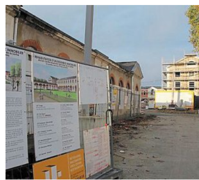
Le site Etoc-Demazy.

La résidence comptera 88 logements, du T2 au T5. Déjà achetés par des investisseurs, qui bénéficient d'une défiscalisation au regard de loi Monuments historiques, « ils seront livrés fin 2019 », confirme l'Atelier Monchecourt, de Paris, maître d'œuvre de cette restructuration-restauration. Qui n'a pas communiqué le montant de l'investissement.