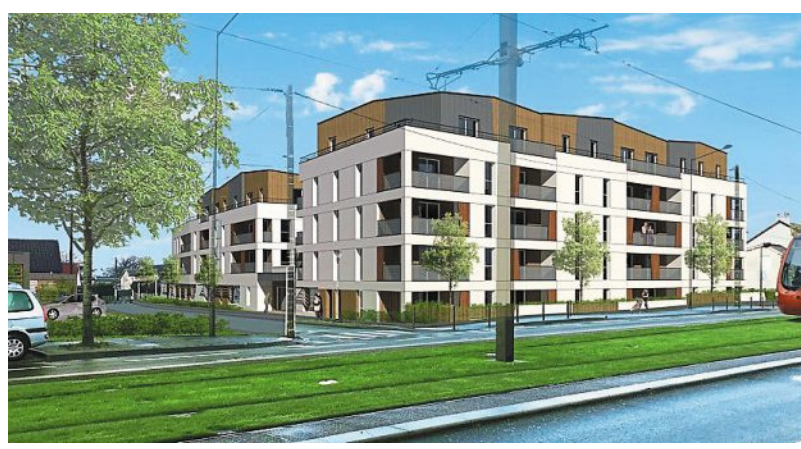
La résidence service seniors Bel Air.